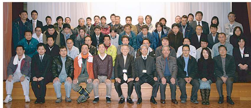
みどりと風工房スタッフと職人さんたち